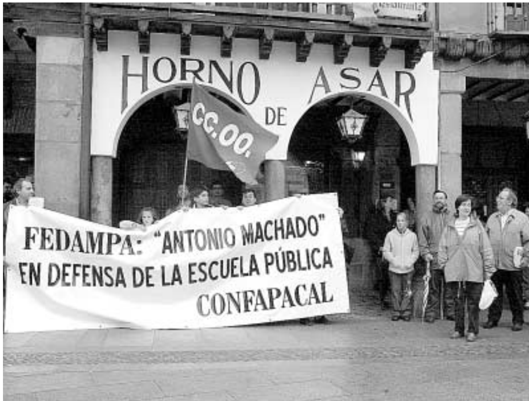
Algunos de los participantes en la concentración se protegen de la lluvia en el Azoguejo.