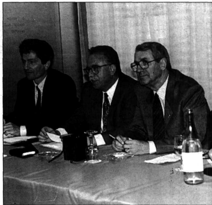
Los socios participan en la campaña

mientos - destacan los promotores de la campaña-, la forma de hacer un club grande, ganador, capaz de alcanzar metas importantes y del que podamos sentirnos orgullosos.