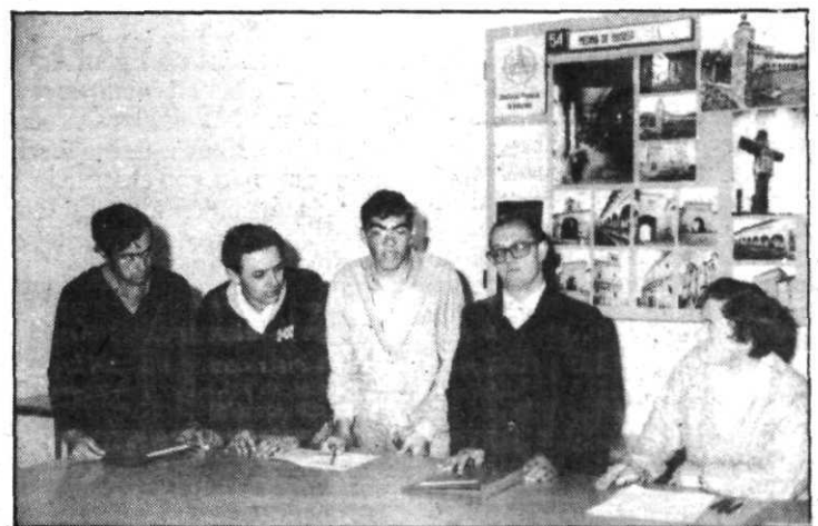
La idea es integrar a los deficientes en la sociedad.

La creación de este centro de estudios estaría subvencionada por la Junta de Castilla y León,