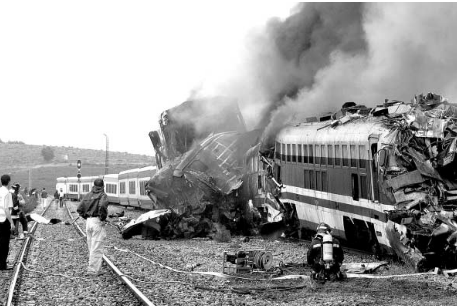
Las dos locomotoras quedaron destruidas por el impacto y las llamas.

► VIENE DE LA PÁGINA ANTERIOR atención a los familiares, el 902 200 215. Los viajeros que no sufrieron daños fueron trasladados en autobuses a sus lugares de destino.