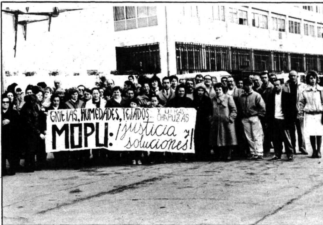
Los vecinos esperaron la llegada del ministro con sus pancartas.

En otro apartado de su escrito, los educadores critican el actual convenio «que perjudica gravemente a los intereses del colectivo educador, por el aumento de la jornada laboral y la pérdida de derechos adquiridos respecto a períodos vacacionales». Al final dicen que «la Administración se inhibe a la hora de establecer calendarios laborales y horarios de acuerdo con el convenio vigente, lo que lleva a una absoluta arbitrariedad de organización en cada centro».