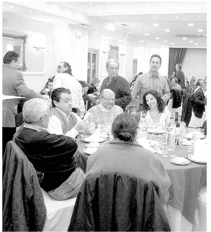
Asistentes a la cena del año pasado.